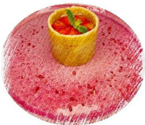
Полунично- йогуртовий мус