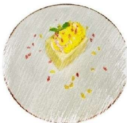
Бабл гам (200 грам)