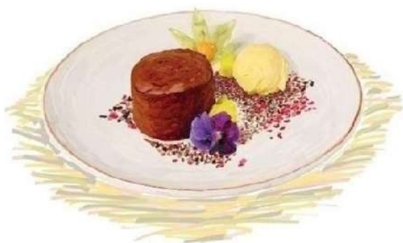
Шоколадний Фондан (230 грам)