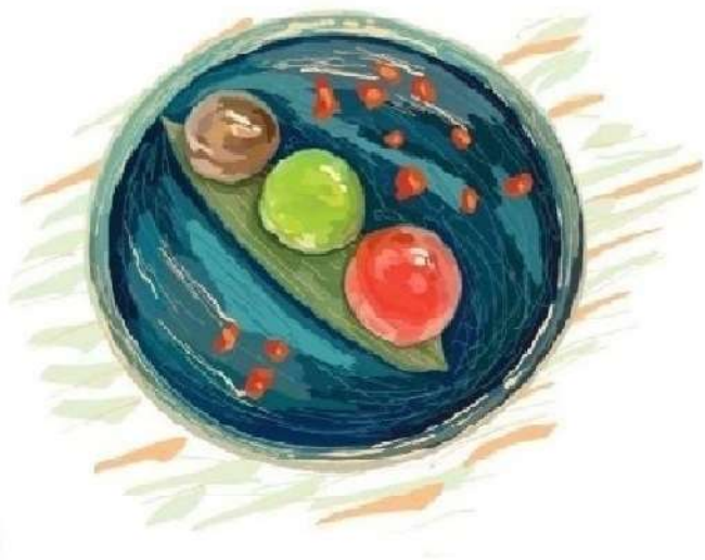
Дайфуку (165 грам)

(фісташка-малина, шоколад-карамель, полуниця-лайм)