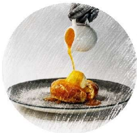
Яблучний пиріг з морозиво та апельсиновим лікерем (250 грам)