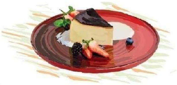
Баскський чізкейк (180 грам)